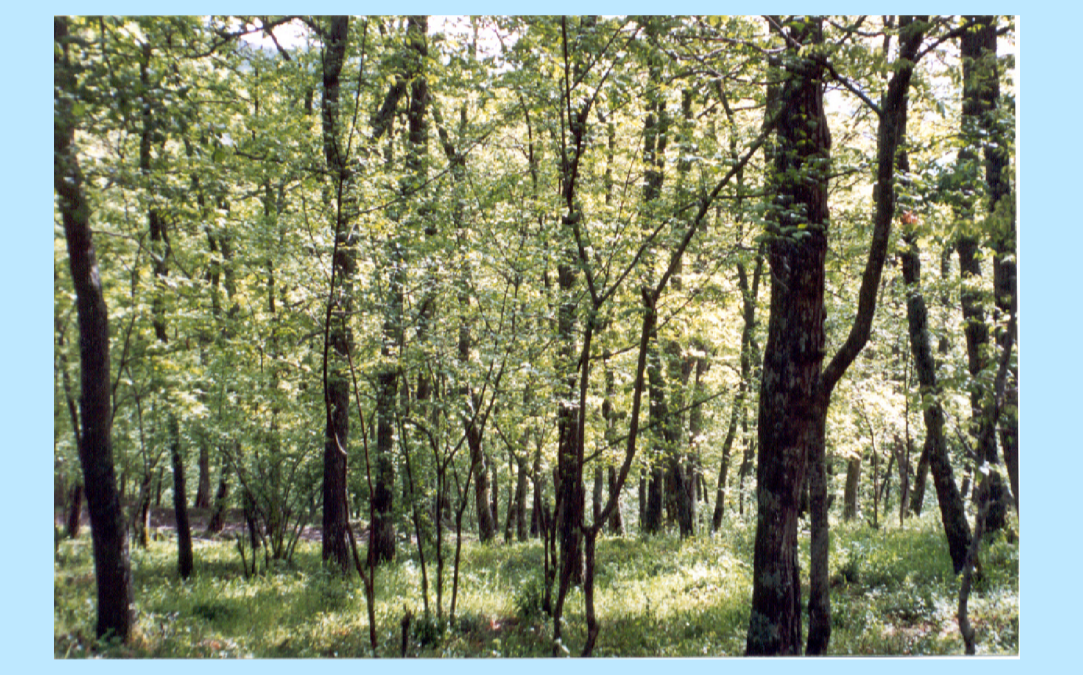
Classi di valore ambientale nel SIC di Gravine di Matera (IT9220135)

PROGETTO: la fauna selvatica nella valorizzazione delle risorse naturali e della biodiversità